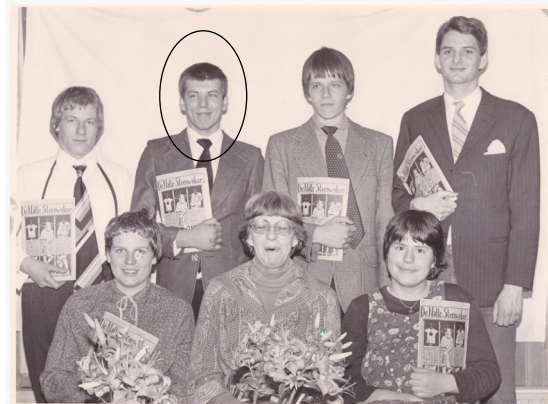
De eerste clubkrantredactie van De Natte